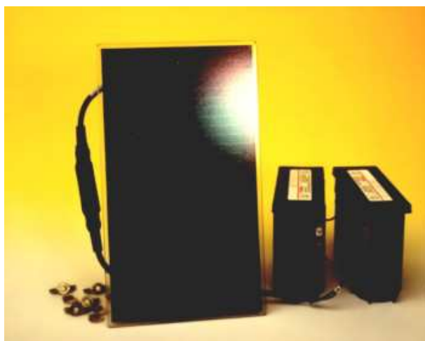
Ex. : Ensemble SECA-B 12C pour un couple de postes RTC

Tous les détails techniques page suivante