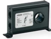
Steca PA HS200 Shunt