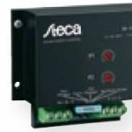
Steca PA 15 Commande à distance